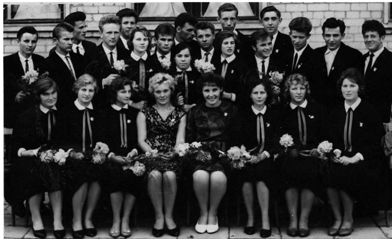
Mūsų klasė. 1964 m.